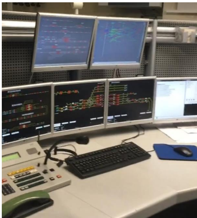
Рисунок 5 – Пост ДСП

Впечатления о поездке в город Гота у меня только положительные. При посещении университета меня удивила масштабность лабораторных установок. Мне понравилось то, что студентам предоставляется возможность достаточно подробно изучить материал не только в теории, но и на практике при помощи лабораторных стендов. Я считаю, что такой метод обучения является наиболее эффективным в плане усвоения материала и в дальнейшем применении знаний на реальных устройствах.