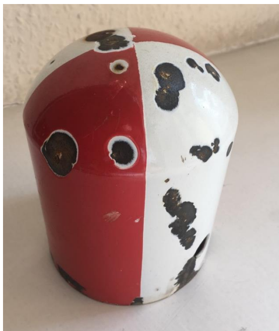
Рисунок 2 – Вид предельного столбика