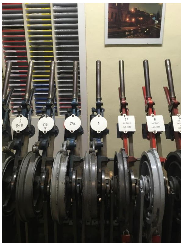
Рисунок 3 – Рычаги для управления переводом стрелок и сигналов

Механической централизацией называется система, при которой стрелки и сигналы переводятся силой человеческой руки. Это наиболее ранний тип централизации, такие установки до их пор находятся в эксплуатации. В механической централизации каждая стрелка переводится рычагом посредством тяг, связанных со стрелочными переводами.