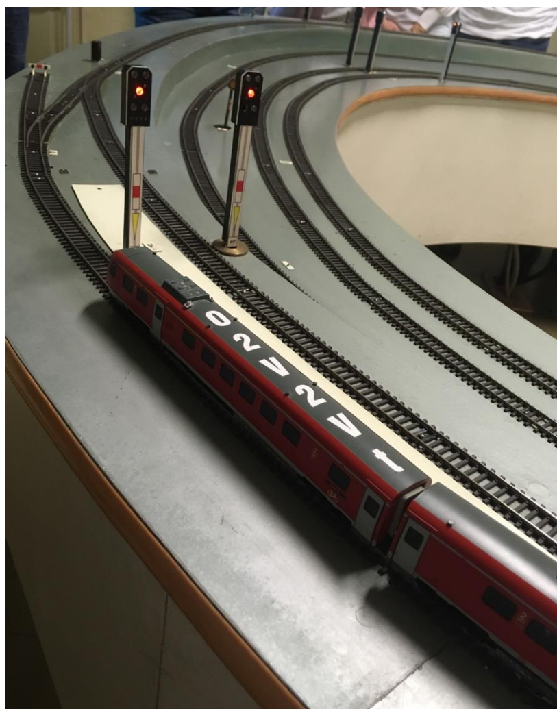
Рисунок 1 – Вид лабораторного стенда

Централизация представляет собой сочетание стрелочных и сигнальных устройств, находящихся во взаимной зависимости, позволяющей производить их перевод в заранее установленном порядке и тем самым не допускать одновременного открытия сигналов для враждебных маршрутов.