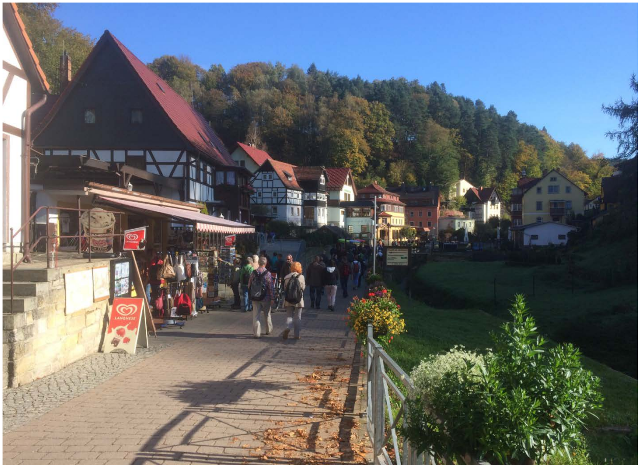
В Саксонской Швейцарии