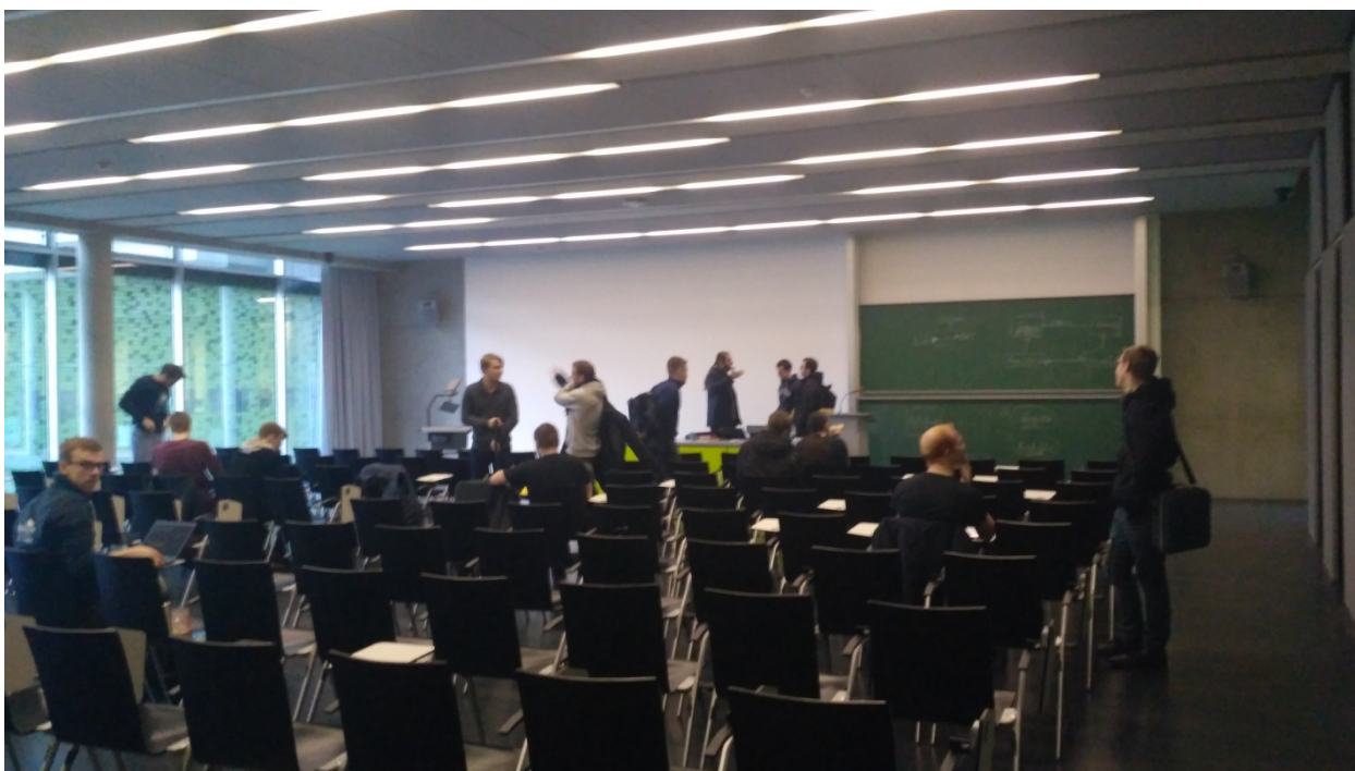
Одна из лекционных аудиторий

Все выбранные мною предметы проходили на английском языке. Первый месяц обучения был самым тяжелым, потому что у меня были сложности с пониманием речи преподавателя в полном объеме. Всю информацию по пройденной теме для дальнейшего изучения можно найти и скачать на официальном сайте вуза после окончания лекции и практических занятий. Самое главное в учебе – правильно распределять свое время. От этого будет зависеть ваша успеваемость. При составлении расписания