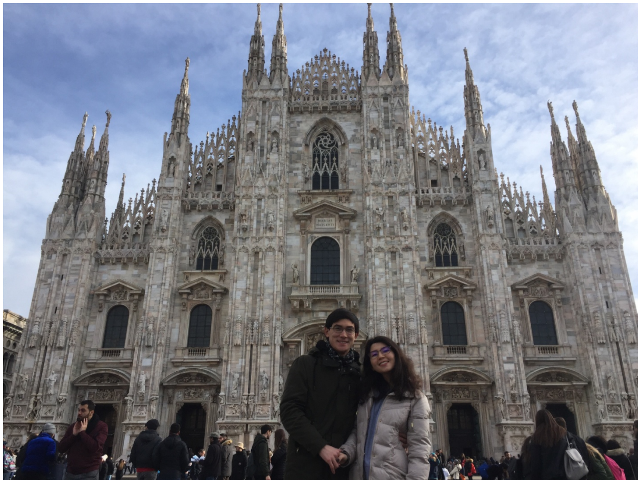
Собор Рождества Девы Марии (Милан, Италия)

Мы были поражены красотой Саксонии. После такого опыта при любом удобном случае я старался посетить как можно больше новых мест. Если вы решили путешествовать по Европе, то самый доступный транспорт – это автобусы Flix bus, которые оснащены wi-fi, зарядками для электронных устройств и другими удобствами.