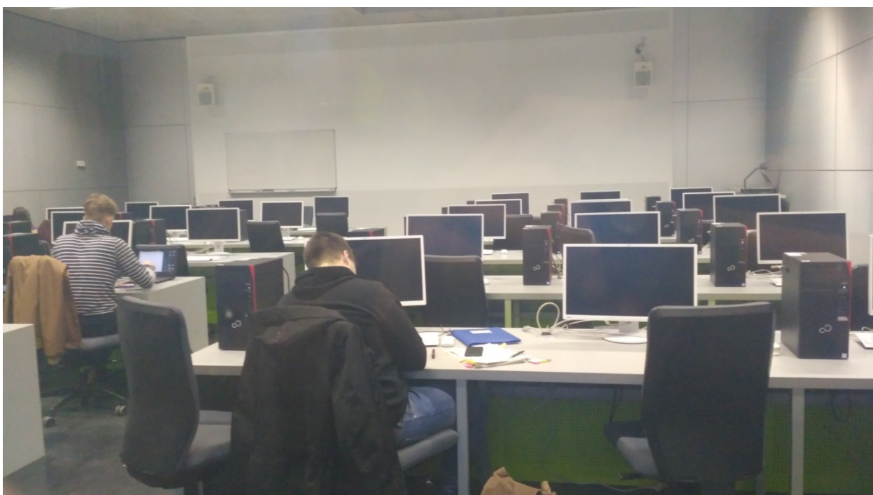
Одна из стандартных аудиторий факультета информационных технологий