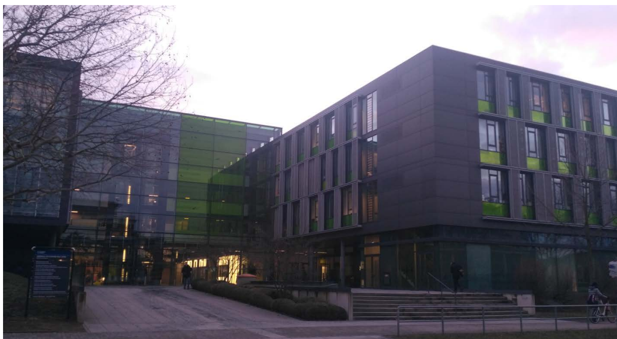
Корпус факультета информационных технологий