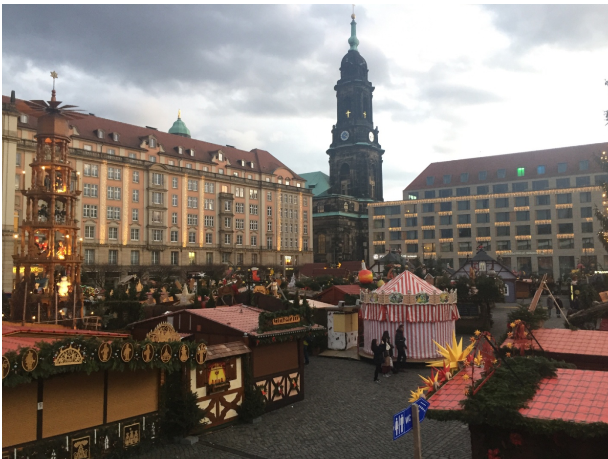
Ярмарка на площади

В заключении хотелось бы отметить, что семестровое обучение в Германии стало для меня полезным опытом. Я познакомился с интересными людьми, благодаря которым узнал много нового. В процессе обучения я приобрел новые знания и получил возможности для моего интеллектуального и карьерного роста. Хочу выразить свою признательность ОмГУПСу за предоставленную мне возможность пройти семестровое обучение в Техническом университете Дрездена.