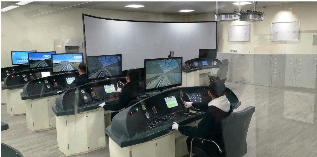
Тренажеры машинистов поезда

На этих тренажерах студенты отрабатывают все технологические операции при ведении поезда. Мы также попробовали себя в роли машинистов.