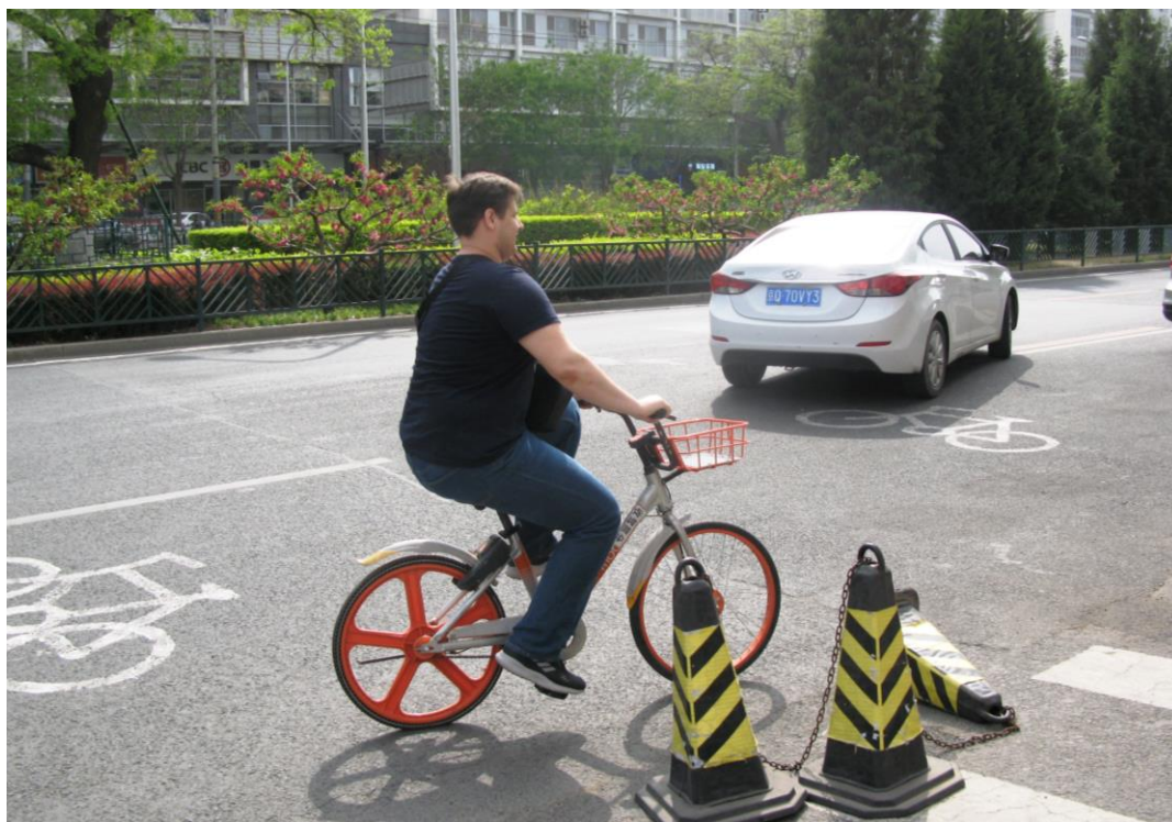
Передвижение по городу в традиционном китайском стиле

Также в Пекине есть очень удобная альтернатива общественному транспорту – прокат велосипедов. В городе множество стоянок велосипедов, где можно взять один из них на прокат всего за один юань в час. Это очень удобно и дешево, многие студенты пользуются этим видом транспорта. Попробовали и мы.