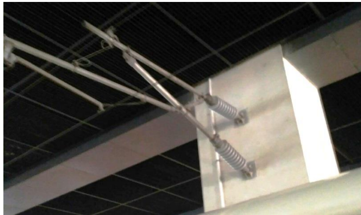
Изолированная консоль контактной сети на станции