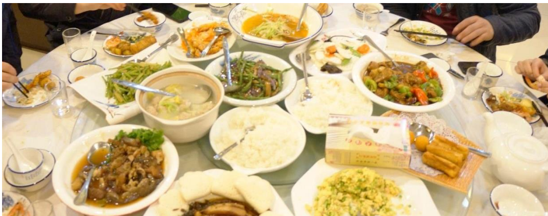
Обед в традиционном китайском стиле

Отдельно стоит сказать про китайскую еду. Еда необычная, большое разнообразие овощей, неприсущих нашей кухне, необычная подача мясных блюд в сопровождении соусов. Большинство блюд достаточно острые.