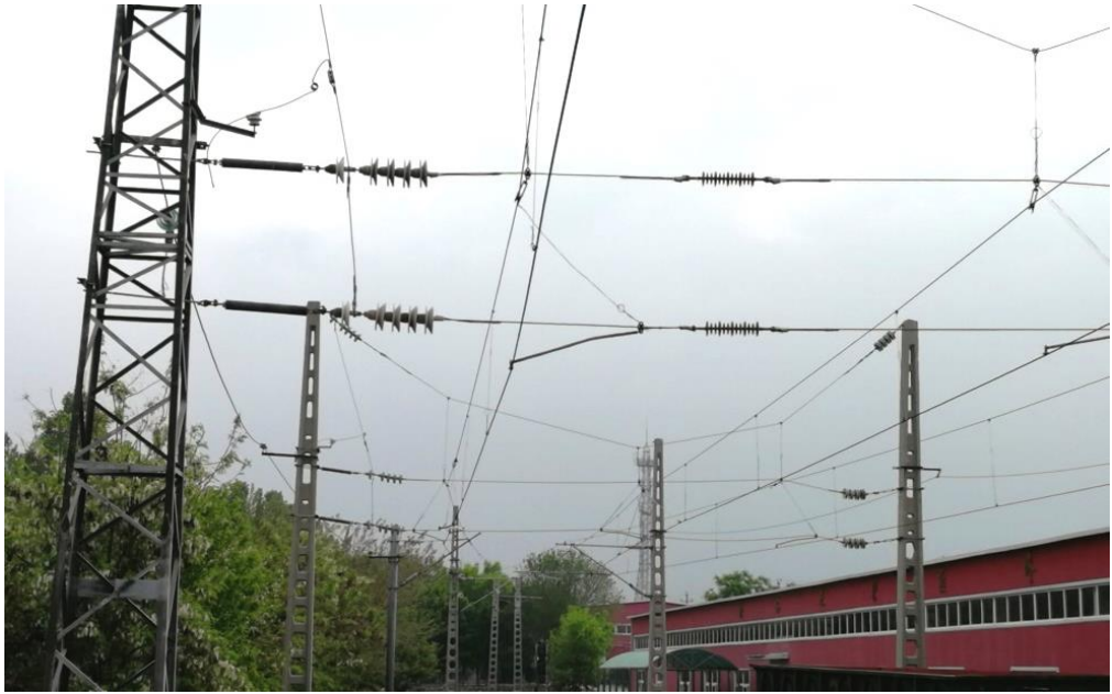
Полигон контактной сети