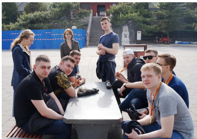
На вершине Великой Китайской стены. Отдых после восхождения

Помимо экскурсий по местным красотам, мы ходили на лекции, на которых нам рассказывали про результаты, достигнутые в железнодорожной деятельности, а особенно в высокоскоростном движении, что помогло Китаю достичь таких высот, и про некоторые виды оборудования, которые помогают организовать высокоскоростное движение. Также администрация Пекинского транспортного университета специально для нас организовала лекцию по основам китайского языка. Это занятие было весьма интересным, и оно сформировало у многих студентов желание в дальнейшем изучать китайский язык.