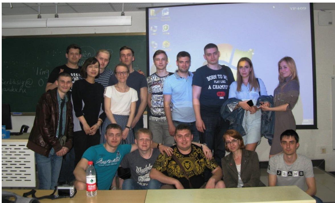
Группа студентов ОмГУПСа с преподавателем после урока китайского языка

Помимо экскурсий по местным красотам, мы ходили на лекции, на которых нам рассказывали про результаты, достигнутые в железнодорожной деятельности, а особенно в высокоскоростном движении, что помогло Китаю достичь таких высот, и про некоторые виды оборудования, которые помогают организовать высокоскоростное движение. Также администрация Пекинского транспортного университета специально для нас организовала лекцию по основам китайского языка. Это занятие было весьма интересным, и оно сформировало у многих студентов желание в дальнейшем изучать китайский язык.