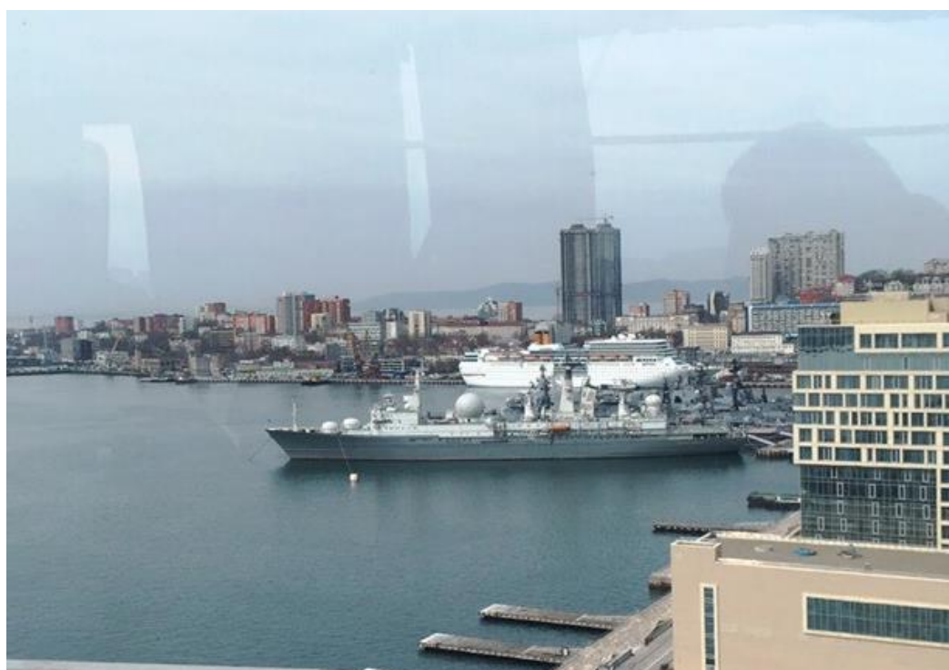
Вид на залив Японского моря