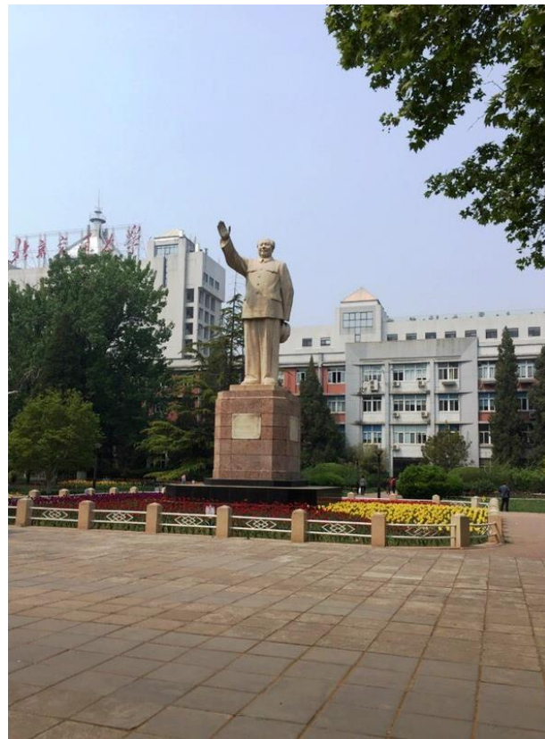
На территории кампуса Пекинского транспортного университета