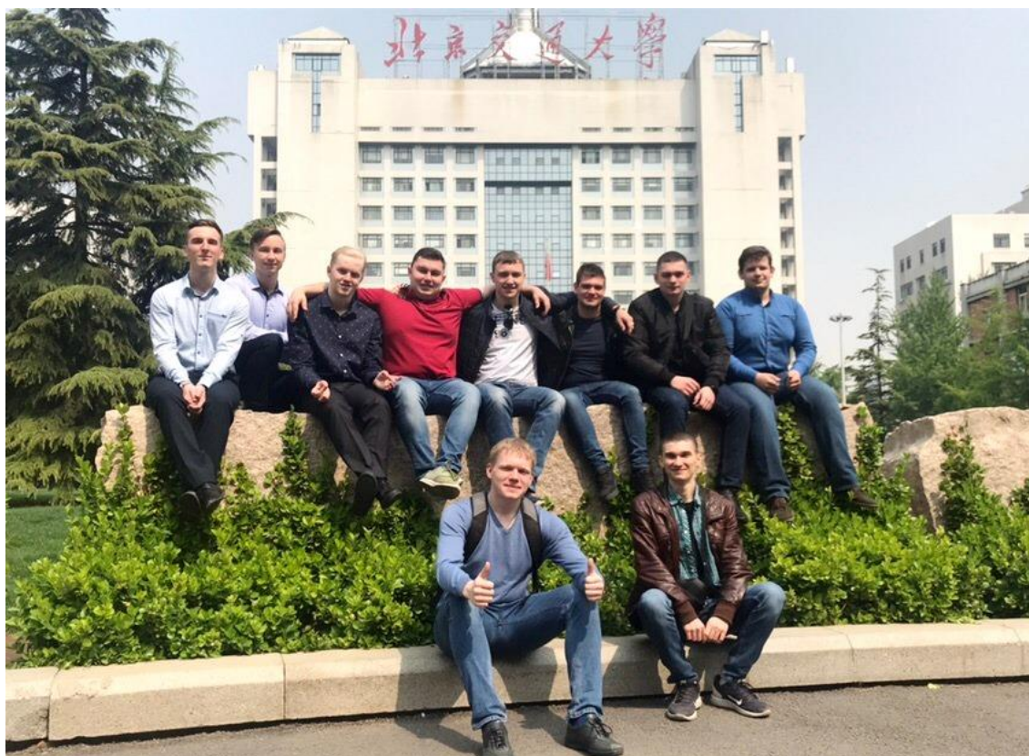
Перед главным корпусом Пекинского транспортного университета