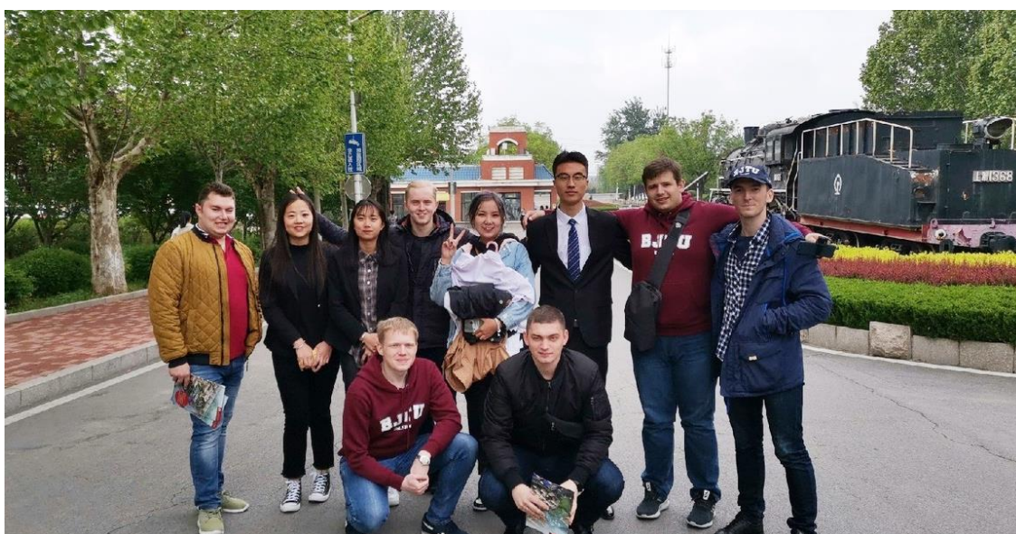
С новыми китайскими друзьями из Цзинаня

Также мы посетили Шаньдунский политехнический институт в городе Цзинань. Он особенно покорила нас своей богатой лабораторной базой. Это так здорово, что студенты изучают не только теорию, но также у них есть возможность закрепить полученные знания на практике. Так как я учусь на специальности «Электрический транспорт железных дорог», для меня было интересно попробовать каждый тренажер по вождению поездов, начиная от простого метро и заканчивая грузовыми и высокоскоростными поездами. Так же почерпнул для себя то, что у них идет больше нацеленность на практику. Очень хотелось бы ввести и у нас такое, добавить больше обучения именно на таких тренажерах и набирать опыт, так сказать, «набивать руку». Кроме тренажеров у них также есть лаборатории, где они досконально изучают пассажирские вагоны метрополитена и отдельные узлы высокоскоростных поездов. Это тоже дает серьезный багаж знаний.