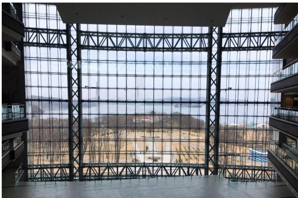
Большое панорамное окно в главном корпусе

По прибытии в город Владивосток нам устроили экскурсию по Дальневосточному федеральному университету (ДВФУ), который находится на острове Русском. Этот университет покорила своими масштабами и обширной территорией. Больше всего впечатлило то, что, несмотря на большую территорию кампуса, там легко можно передвигаться, начиная с бесплатных автобусов для студентов на территории и заканчивая переходами между корпусами университета.