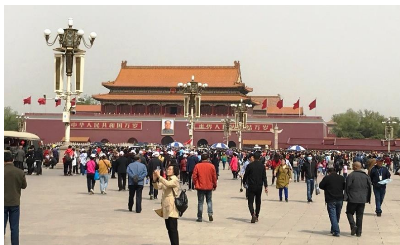
На площади Тяньаньмэнь

Сначала мы познакомились с достопримечательностями Китая, его традициями и первым делом поехали на площадь Тяньаньмэнь, которая, по словам нашего гида, может вместить около миллиона человек.