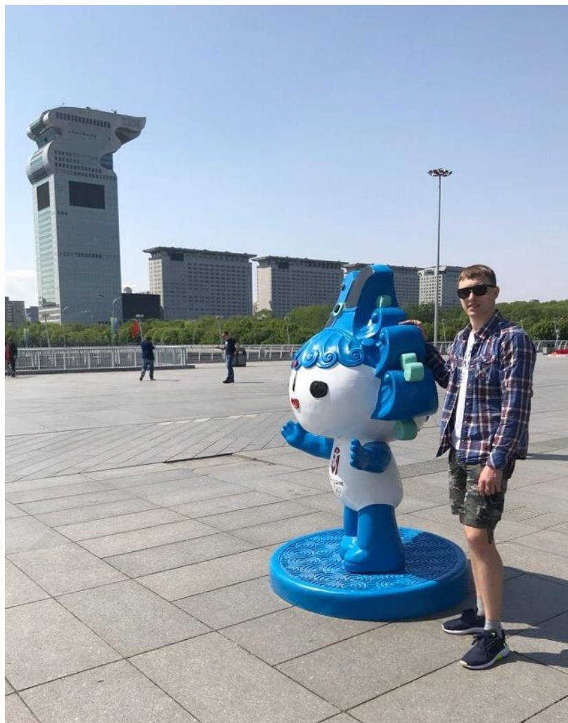
С одним из символов Олимпиады-2008 в Пекине

В последний день пребывания в Китае мы посетили олимпийские объекты и крупные торговые центры, где смогли купить домой различные сувениры.