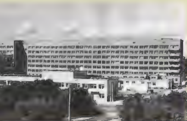
Дорожная клиническая больница на станции Новосибирск-Главный