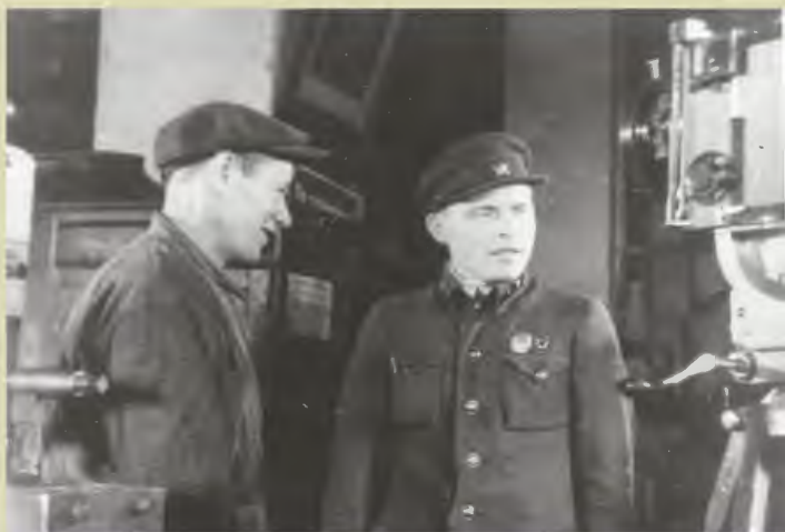
Колонна №31 у паровоза Эм 728-88 на станции Глубокая перед отправлением в очередной рейс, 1943 г.