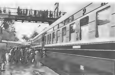
Фирменный поезд «Сибиряк» на станции Новосибирск-Главный

В 1961 году (после объединения с Омской дорогой) он становится начальником вновь образованной Западно-Сибирской железной дороги.