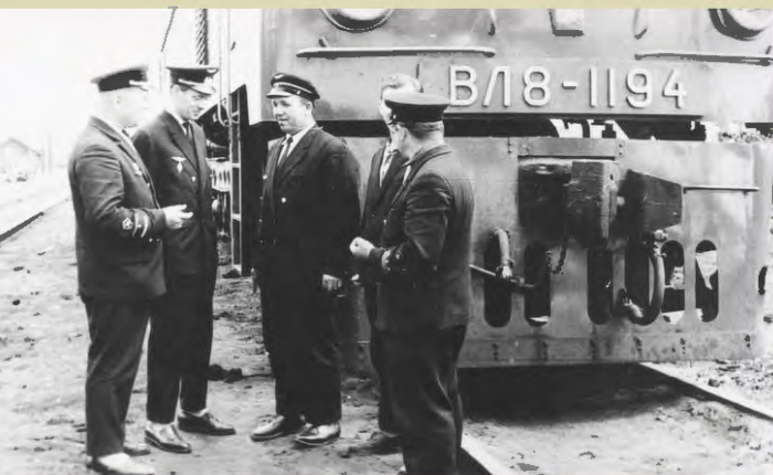
Первый рейс в «одно лицо», станция Инская, июль, 1966 г.