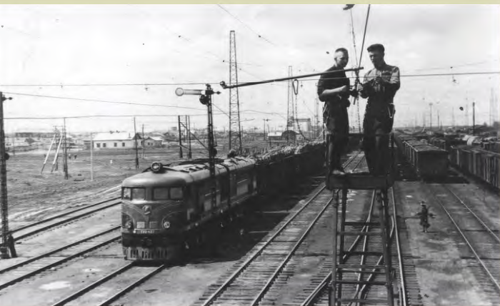
Монтаж контактной сети электрифицированного участка, 1956 г.