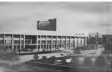
Дворец культуры железнодорожников, 1970-е годы