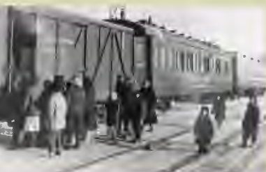
Вагон-клуб в составе поезда