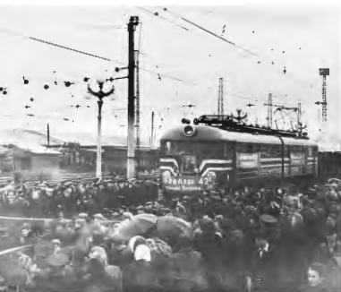
Отправление в путь тяжеловесного состава в честь 42-ой годовщины Октября, 1959 г.