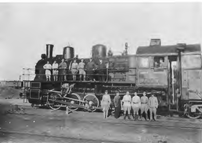
В паровозном депо станции Красноярск