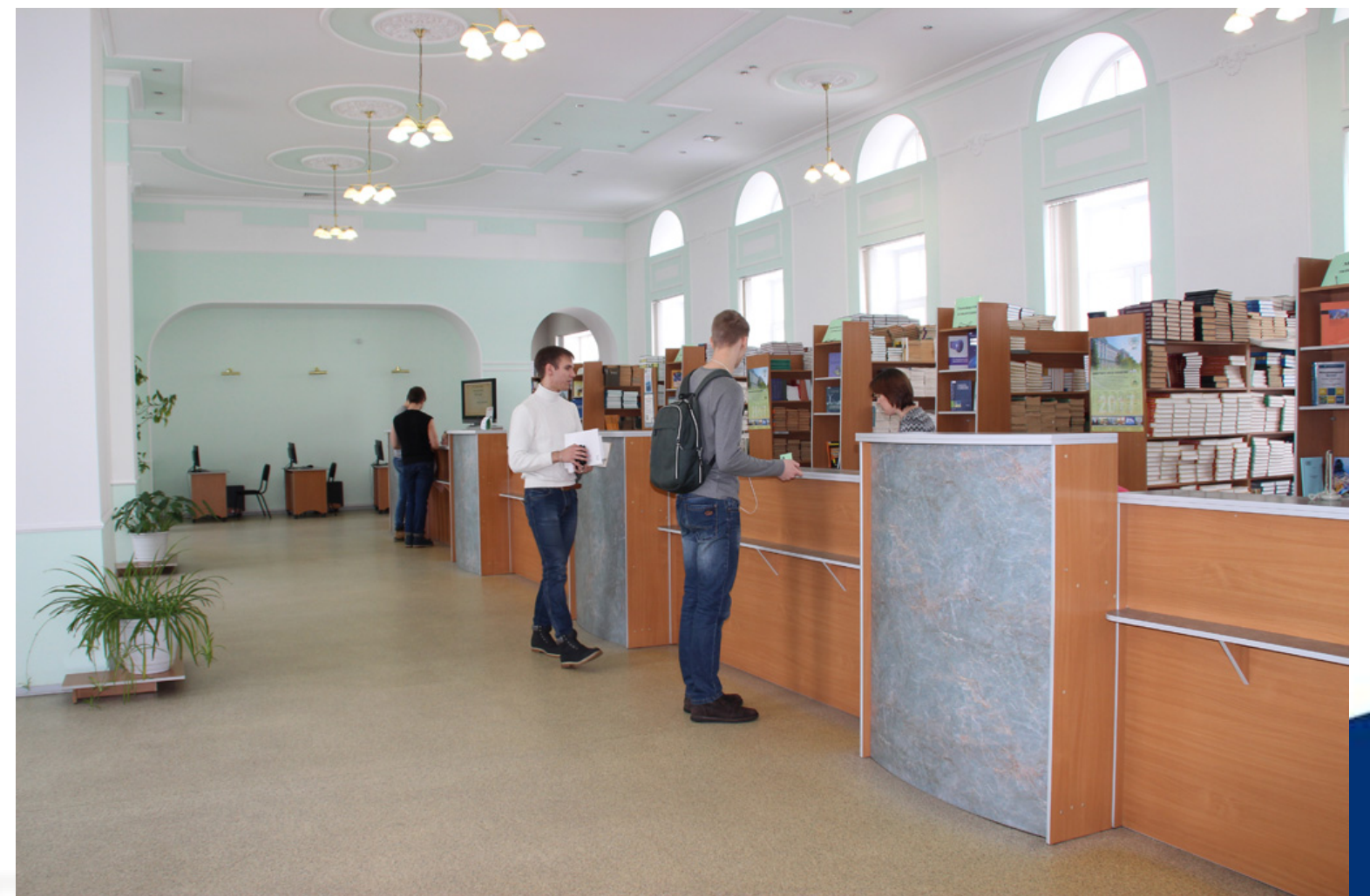
Единый абонемент выдачи учебной и научной литературы