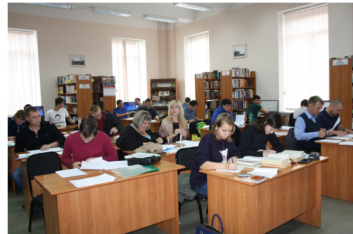
Центр гуманитарных знаний и медиаресурсов