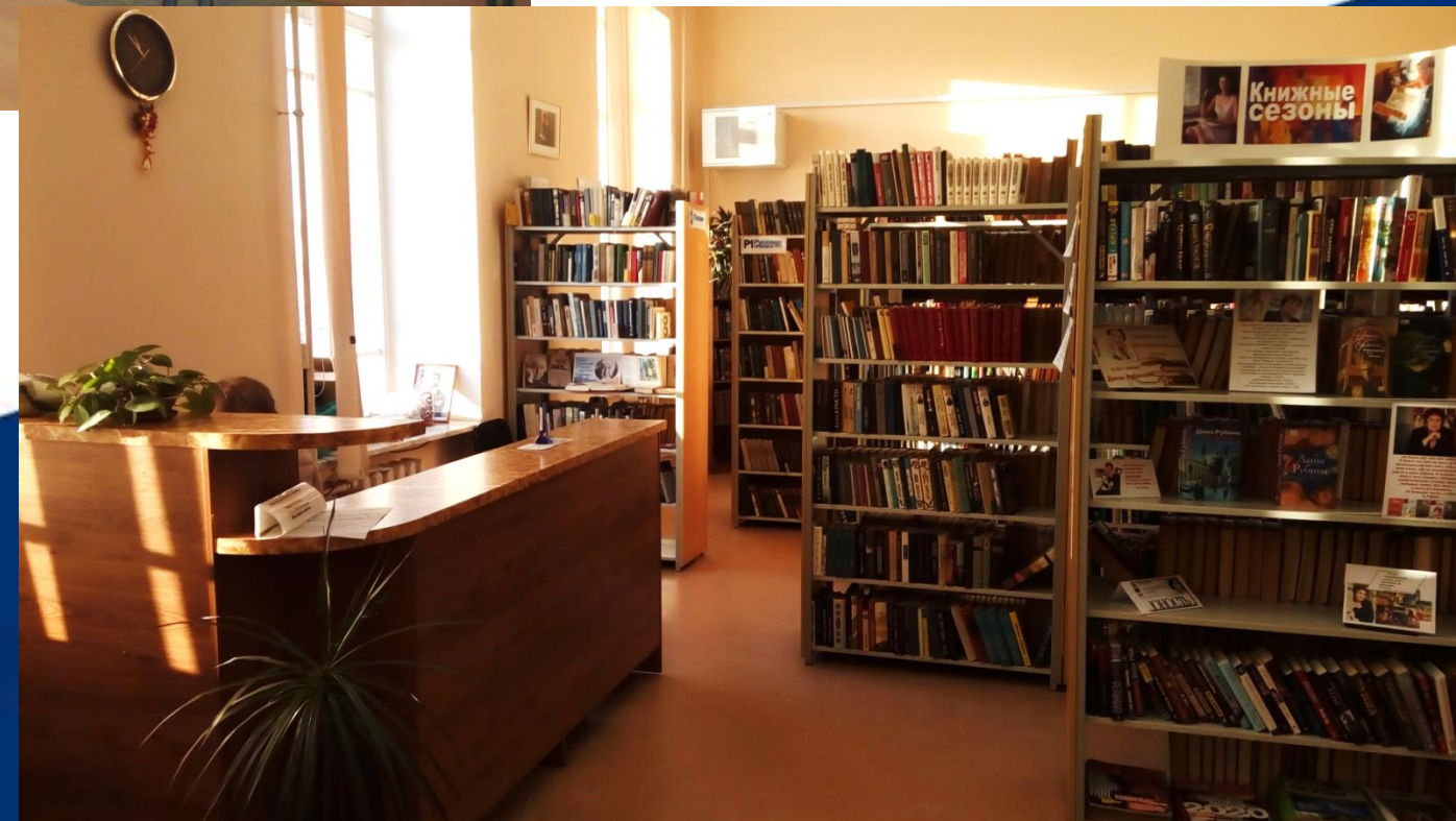
Абонемент художественной литературы