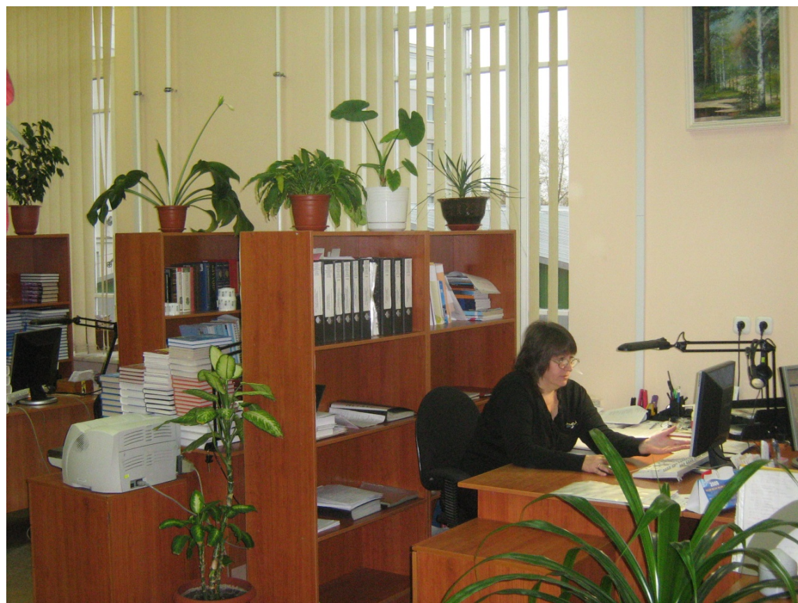
Отдел комплектования и научной обработки фонда